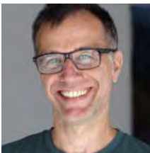
Kulturamtsleiter Leitung PUC Kulturzentrum